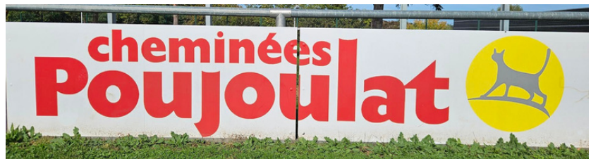
Panneau 4m x 0.80m :